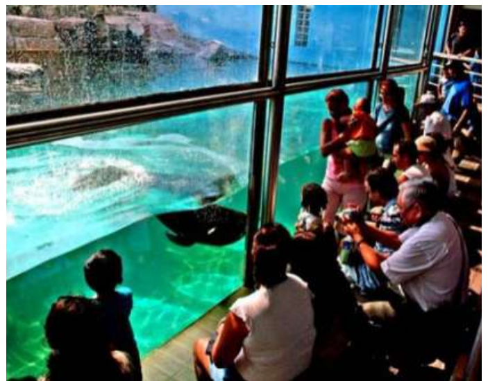
Ultra le centro historic e urban, Santos anque ha como attraction touristic le Aquario e le tram al Monte Serrat.

Actualmente Santos es un del plus bon nivello de vita pro habitar e anque pro retiratos a causa que illo possede diverse servicios social pro iste publico.